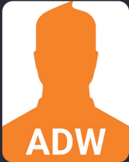
Micha Teweleit (4. Wilnf M.Sc.) WiWi-O-Phase Ersti-WE Guide

FSP/Fakultätsrat 74 StuPa/Senat (GDF) 132