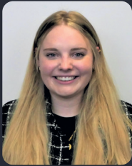
FSP/Fakultätsrat 67 StuPa/Senat (GDF) 75