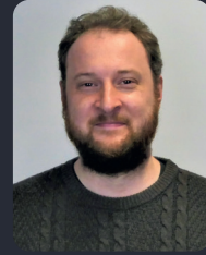
FSP/Fakultätsrat 69 StuPa/Senat (GDF) 68

Statt der klassischen 3x3 Felder müssen hier innerhalb eines Farbereiches alle Zahlen von 1-9 vertreten sein. Das Gleiche gilt wie gewohnt auch für die senkrechten und horizontalen Reihen. Viel Erfolg beim Lösen!