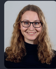
FSP/Fakultätsrat 47 StuPa/Senat (GDF) 73