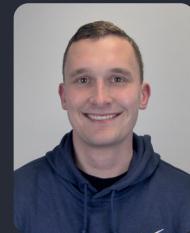
FSP/Fakultätsrat 80 StuPa/Senat (GDF) 100