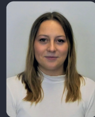
FSP/Fakultätsrat 71 StuPa/Senat (GDF) 144