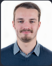
FSP/Fakultätsrat 65 StuPa/Senat (GDF) 64