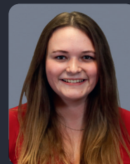
FSP/Fakultätsrat 15 StuPa/Senat (GDF) 31