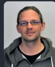
FSP/Fakultätsrat 79 StuPa/Senat (GDF) 96

(5. IntEco M.Sc.) ehem. Wahlkampf AG, MVK Guide