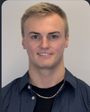
FSP/Fakultätsrat 50 StuPa/Senat (GDF) 99

(5. BWL B.Sc. & Jura StEx) ehem. Lehrpreis AG, MVK Guide, Vorsitzende HHA