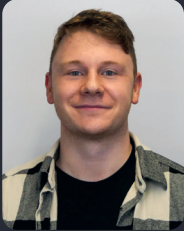
FSP/Fakultätsrat 26 StuPa/Senat (GDF) 125

(3. BWL B.Sc.) MVK Guide, Ersti-WE Guide