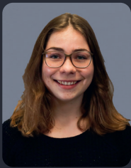
FSP/Fakultätsrat 49 StuPa/Senat (GDF) 93