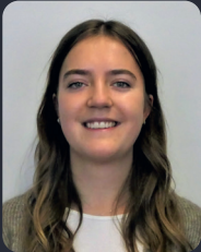
FSP/Fakultätsrat 35 StuPa/Senat (GDF) 84

(7. Wilnf B.Sc.) ehem. Wahlkampf Orga, Ersti-WE Guide