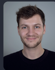
FSP/Fakultätsrat 16 StuPa/Senat (GDF) 90

(7. WiPäd/Politik B.A.) FSR Öffentlichkeitsreferentin