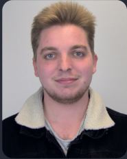
FSP/Fakultätsrat 66 StuPa/Senat (GDF) 95

(15. VWL & Politik B.A.) ehem. stellv. ADW Vorsitz, MVK Guide