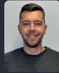
FSP/Fakultätsrat 46 StuPa/Senat (GDF) 145