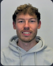
FSP/Fakultätsrat 34 StuPa/Senat (GDF) 42

(3. BWL B.Sc.) FSR Studienreferentin, MVK Guide