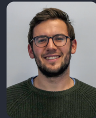
FSP/Fakultätsrat 78 StuPa/Senat (GDF) 76