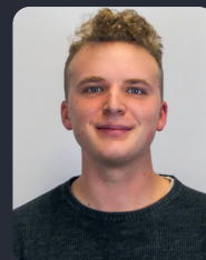
FSP/Fakultätsrat 14 StuPa/Senat (GDF) 40

(7. BWL B.Sc.) ehem. FSR Sprecherin, ehem. MVK-Orga