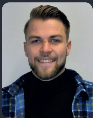
FSP/Fakultätsrat 68 StuPa/Senat (GDF) 137