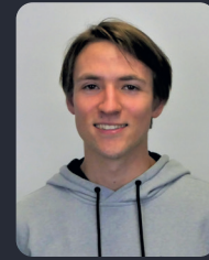
FSP/Fakultätsrat 48 StuPa/Senat (GDF) 83