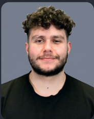
FSP/Fakultätsrat 4 StuPa/Senat (GDF) 48