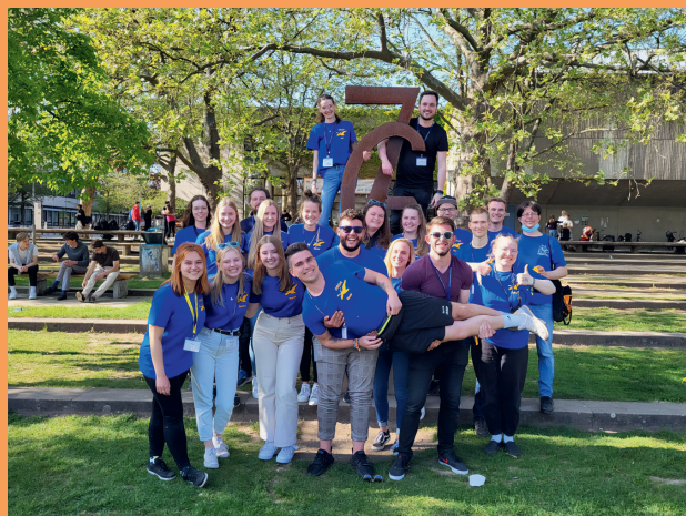
Die Fachschaft auf der BundesFachschaftenKonferenz

Wir freuen uns auf ein weiteres Jahr, in dem wir für euch aktiv sein dürfen!