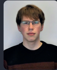
FSP/Fakultätsrat 70 StuPa/Senat (GDF) 116

(15. VWL & Portugiesisch B.A.) ehem. FSR Sprecher und ADW Vorsitz