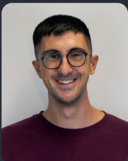
FSP/Fakultätsrat 28 StuPa/Senat (GDF) 127

(5. IntEco M.Sc.) ehem. FSR, ADW ÖffentlichkeitsreferentIn