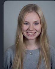
FSP/Fakultätsrat 13 StuPa/Senat (GDF) 112