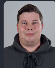
FSP/Fakultätsrat 72 StuPa/Senat (GDF) 56